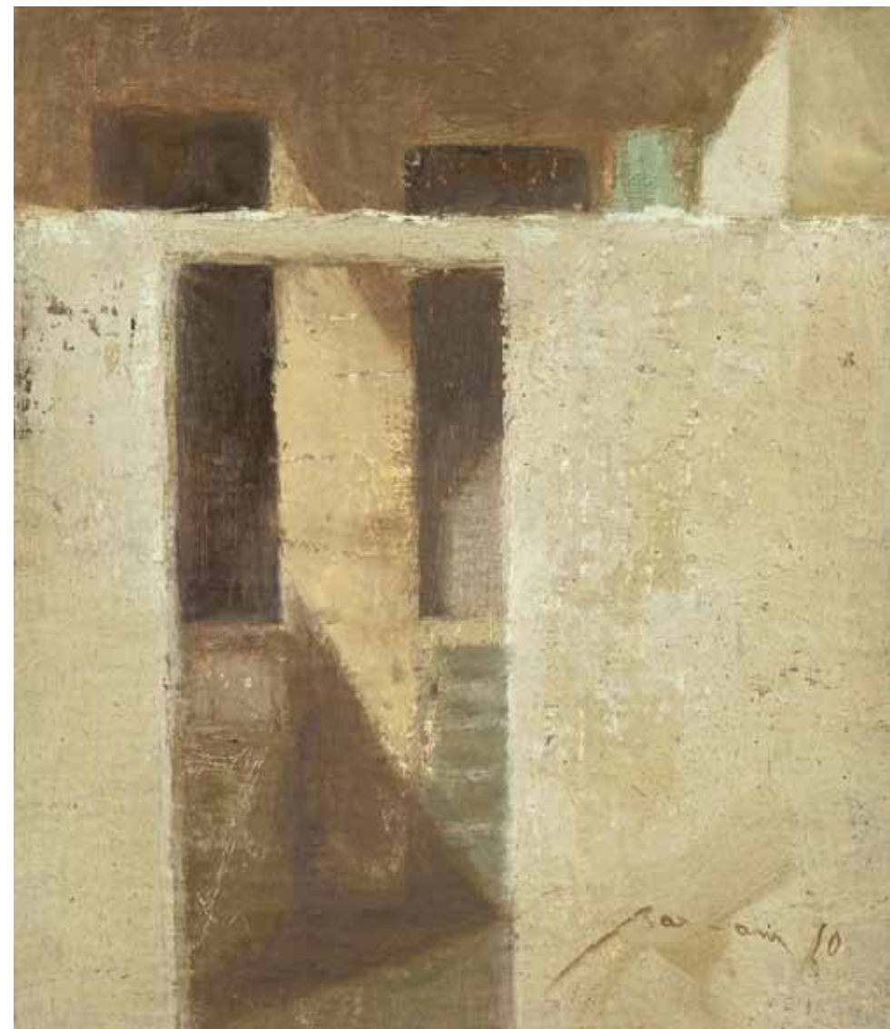
Entrance, Late in the Day Oil on linen mounted on wood 19.5 x 17 cm 2010