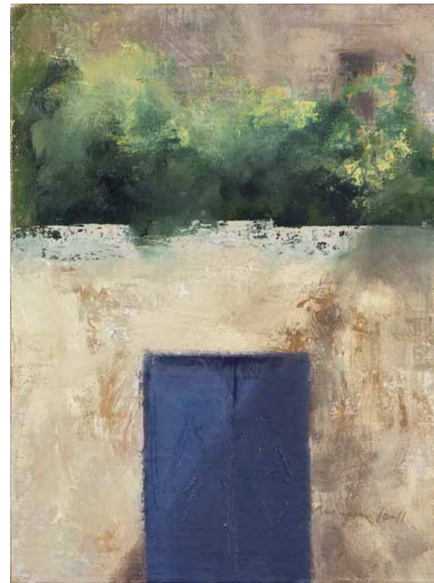
25 Shabazi Oil on linen mounted on wood 26 x 19 cm 2010-11