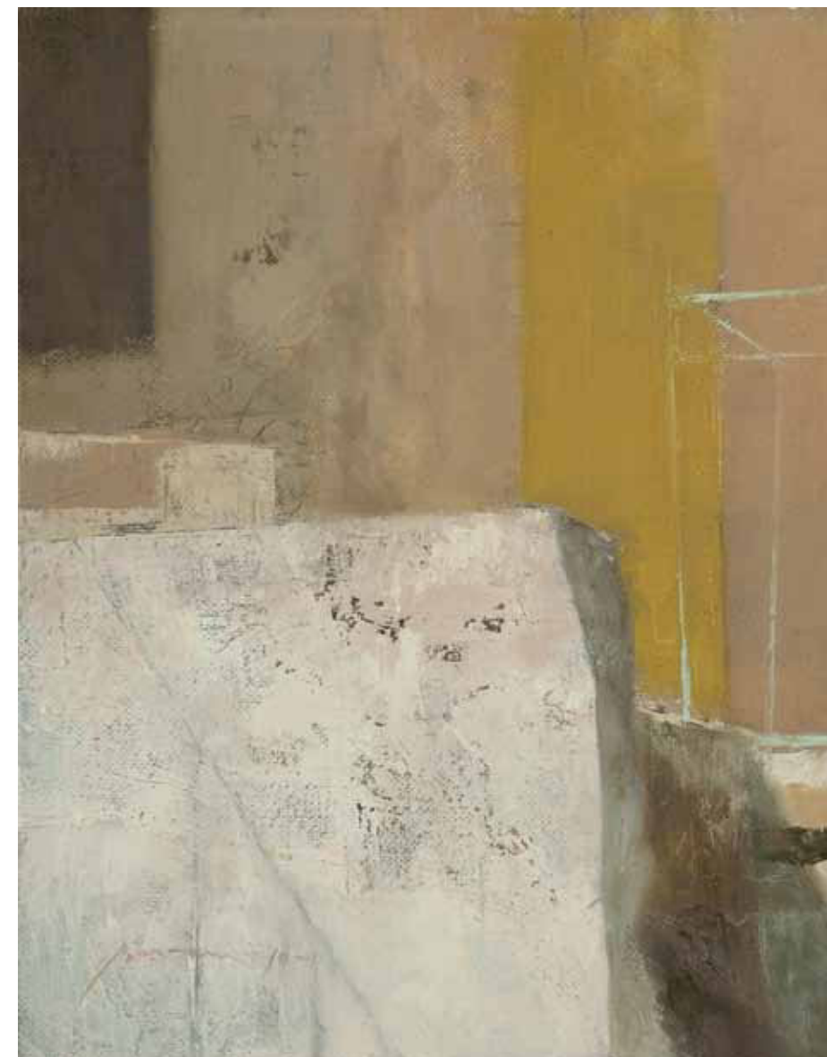
Meeting of Walls, Summer Oil on linen 32 x 25 cm 2010-11

מפגש קירות, קיץ שמן על פשתן 25 x 32 ס"מ 2010-11