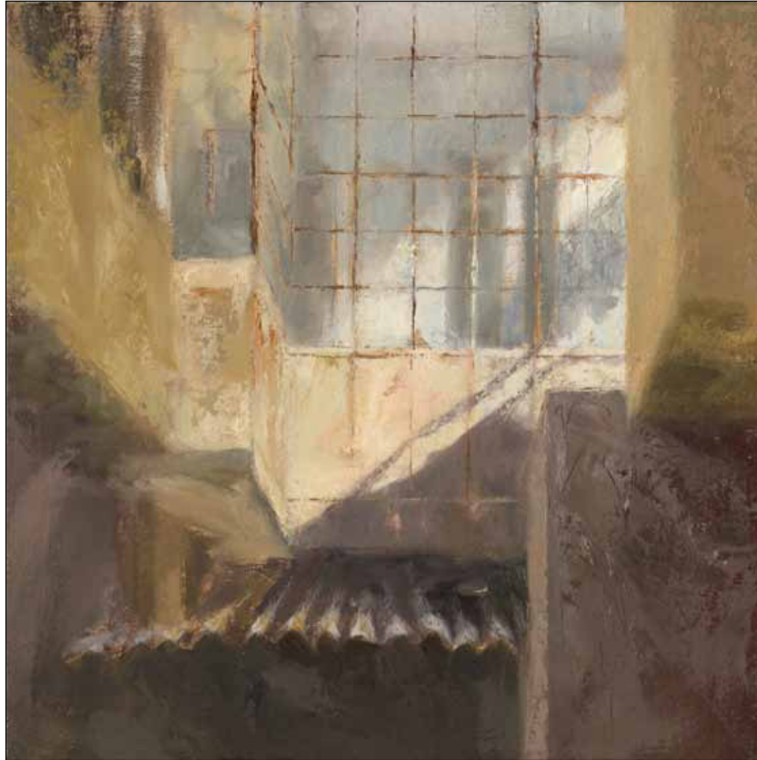
Courtyard, Afternoon, with Tin Roof Oil on linen mounted on wood 29 x 30 cm 2011