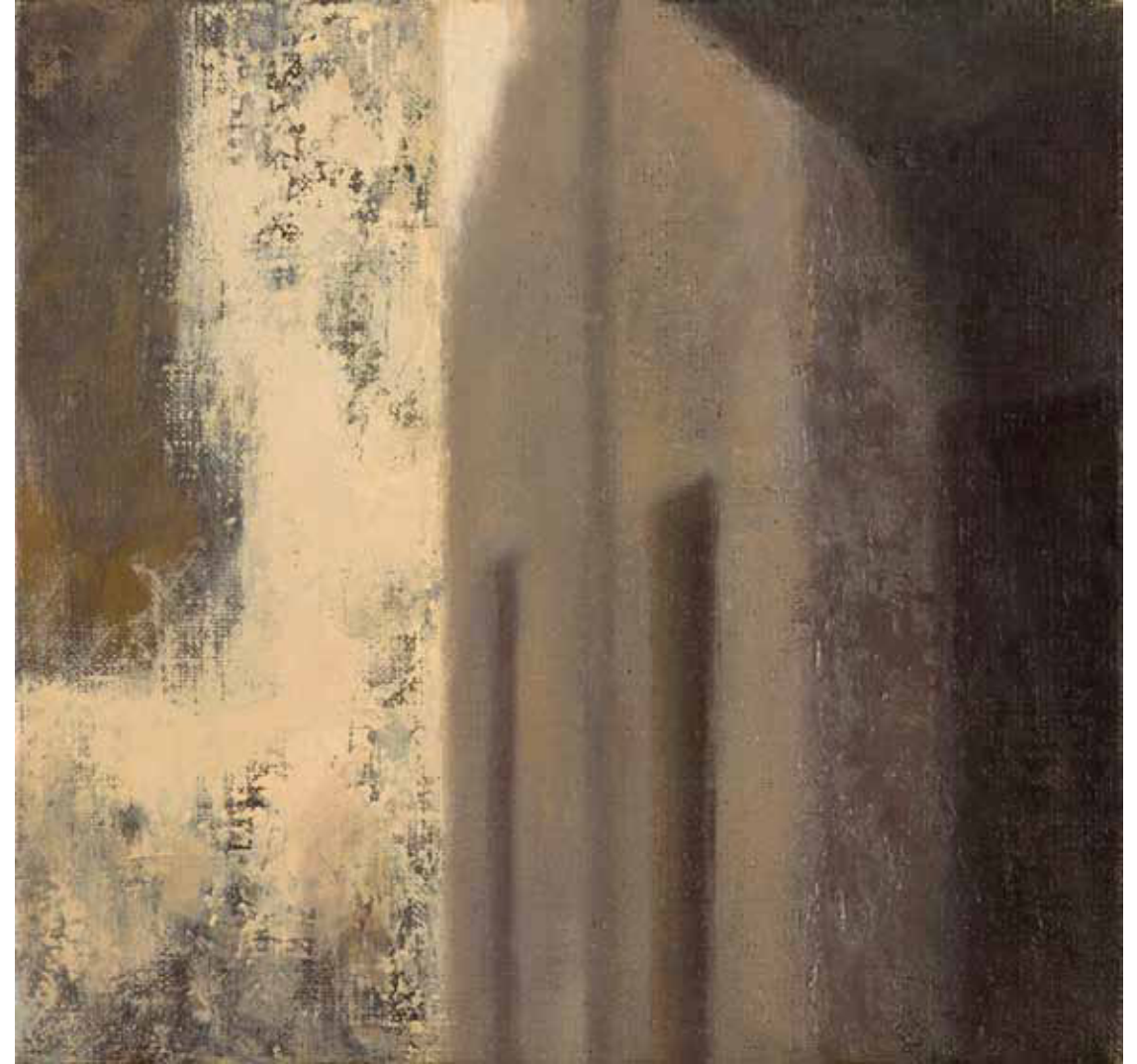
House in Emerging Sun Oil on linen mounted on wood 28 x 29 cm 2011-12