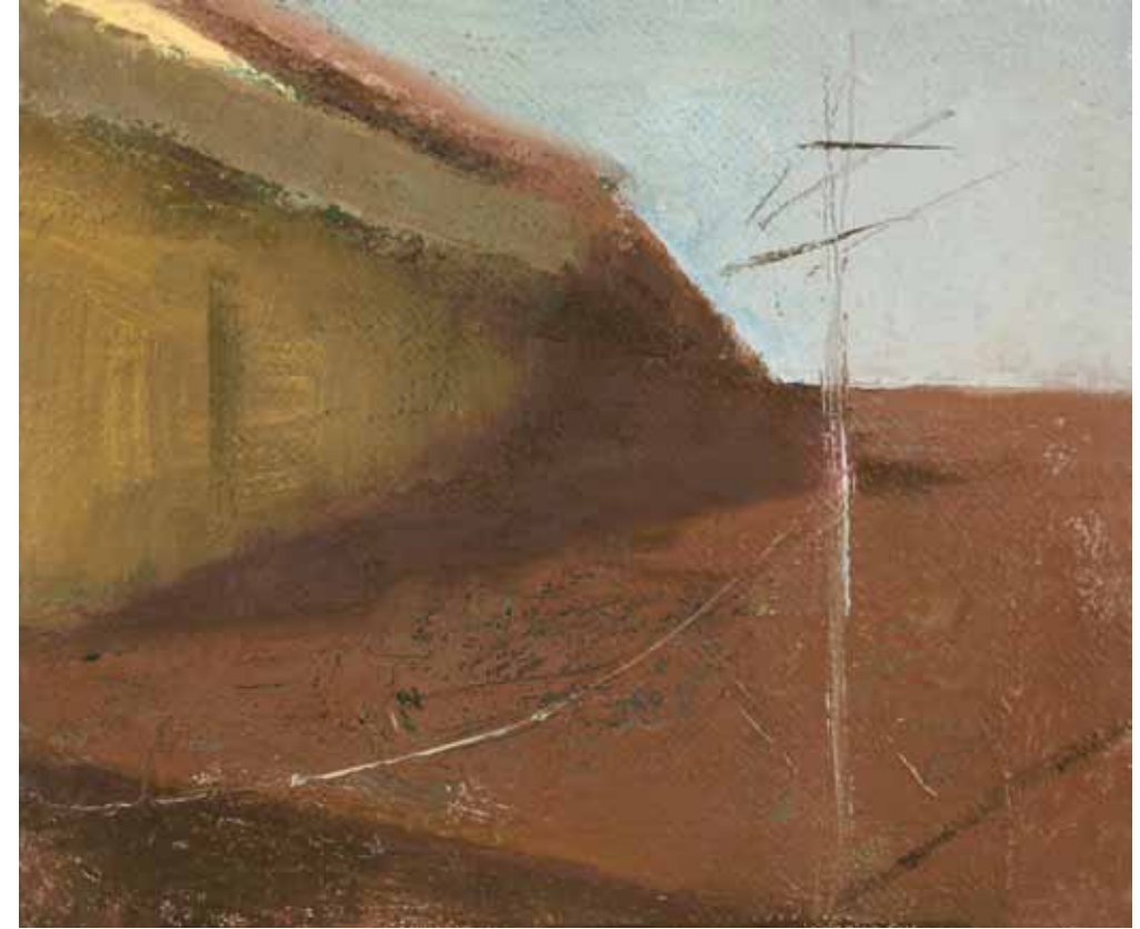
Roof, Late Afternoon Oil on linen 15 x 18 cm 2011