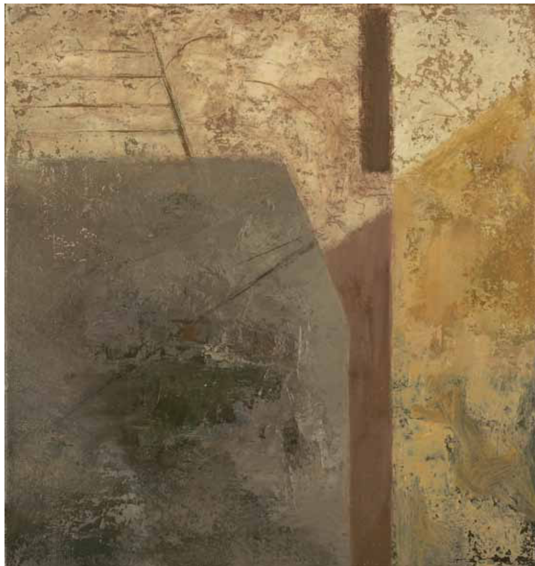
Walls in Strong Light Oil on linen mounted on wood 36 x 33.5 cm 2010-11