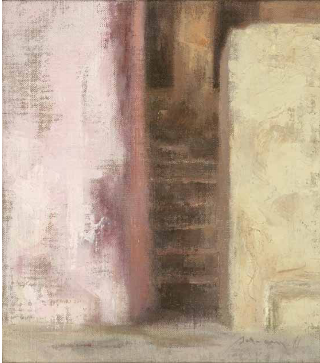
Narrow Entrance Oil on linen mounted on wood 23.5 x 20.5 cm 2011